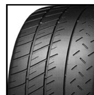
Pilot Sport Cup